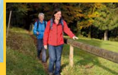
GEHEN MIT ALLEN SINNEN