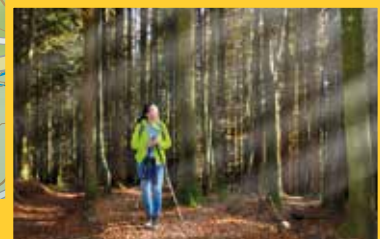
OFFEN SEIN FÜR NEUES